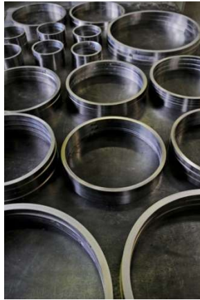
Noyaux Fer-Nickel disponibles en version torique, rectangulaire, C, E... Iron-Nickel cores available in toric, rectangular, C, E, ...shapes

Available tape thickness from 0,02 to 0,3 mm