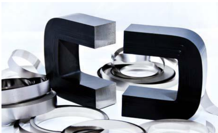
Noyaux Fer-Cobalt disponibles en version torique, rectangulaire, C, E... Iron-Cobalt cores available in toric, rectangular, C, E, ...shapes